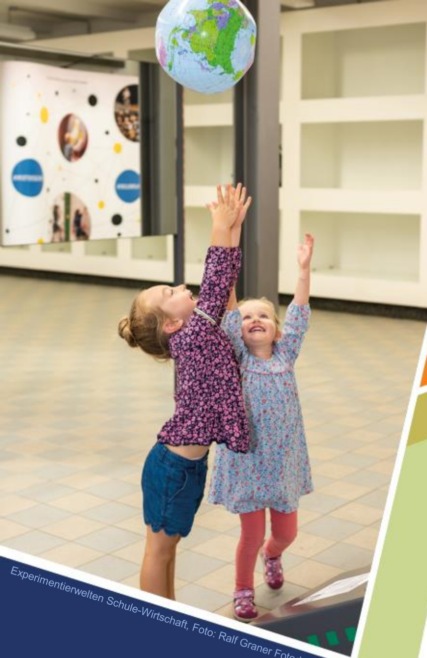
Experimentierwelten Schule-Wirtschaft